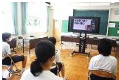
オンライン始業式の様子

2学期が始まり、生徒は元気に登校しました。始業式は、新型コロナウイルス感染予防のため、オンラインでおこないました。生徒は各教室で始業式に参加しました。