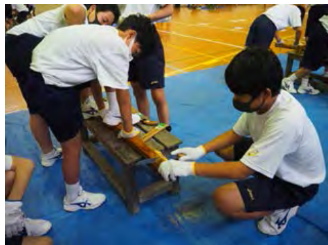
森林学習・山林体験