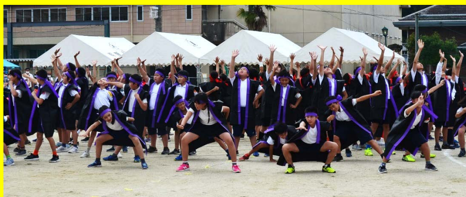
令和2年度 運動会『明小ソーラン』

1学期は新型コロナウイルス感染拡大防止のために、いろいろな制限がありましたが、児童一人一人がめあてに向かってコツコツと頑張ったり、仲間とともに勉強や様々な活動に取り組んだりすることができました。2学期も新型コロナウイルス感染拡大防止対策を十分に行い、教育活動に取り組んでいきます。