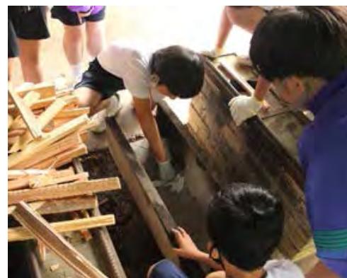
山と水についての話・火おこし体験

クラフトの元になる木がたくさんあって驚きました。木によって色や質感、固さが違うことがよくわかりました。