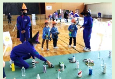
令和2年度子どもひろば事業