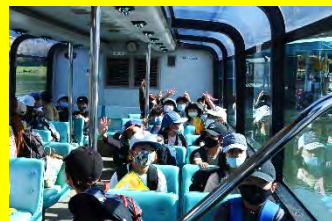
4年生 美濃和紙・関刃物