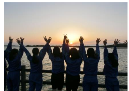
美しい風景に感動