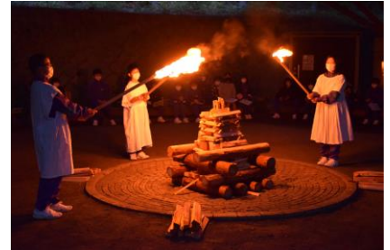
キャンプファイヤー