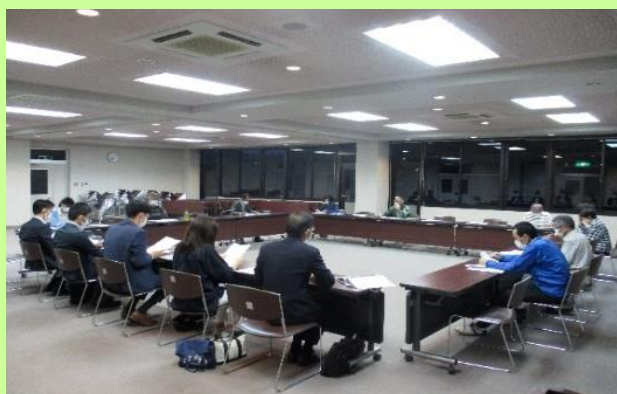
令和4年度第2回安心部会（R4.5.26）

近年中に、バス路線の無い地域の皆様も利用可能となるデマンド交通の導入を考えています。多くの皆様が買い物、通院などに気軽に利用できる仕組みとなるように検討しています。