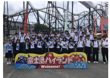
富士急ハイランド