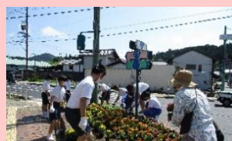
日本大正村交差点（新町交差点）