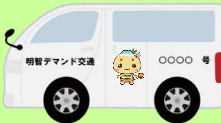
明智デマンド交通(10人乗り)のイメージ