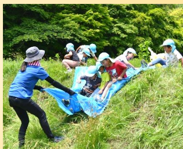
自然の中でのびのび