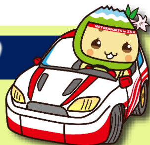
恵那市公式キャラクター 「エーナ」