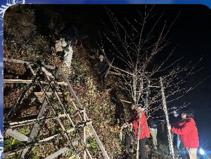
商工会青年部作業風景