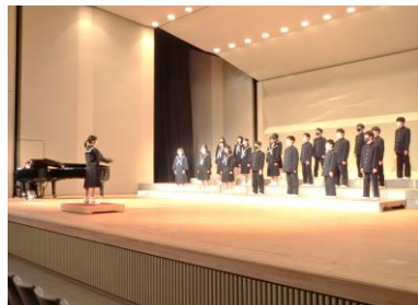
1年B組「Let's search for tomorrow」