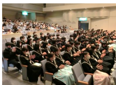
全校生徒によるハンドクラップ