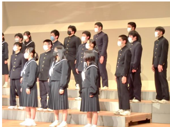
3年生 「言葉にすれば」 「地上の星」