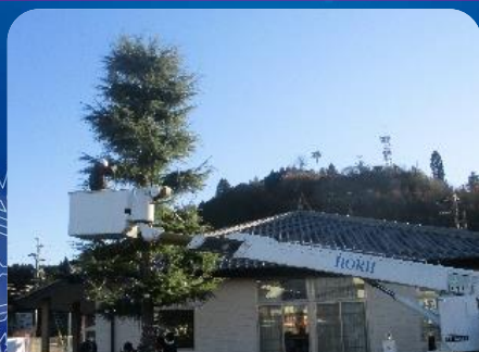
まいまいくらぶ作業風景