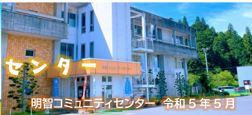
明智コミュニティセンター 令和5年5月