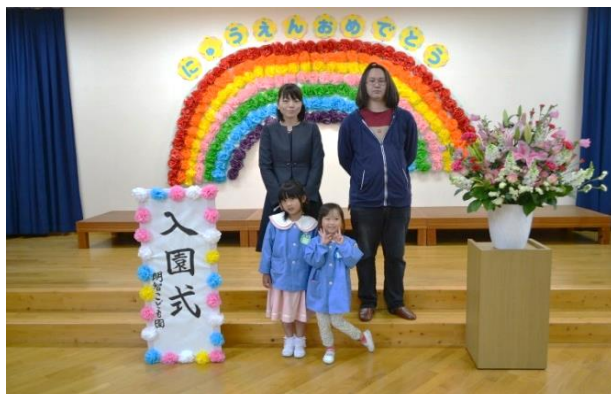
年長ぞう組きりん組