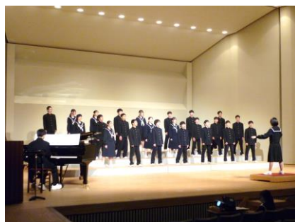
1年生合唱「友～旅立ちの時～」