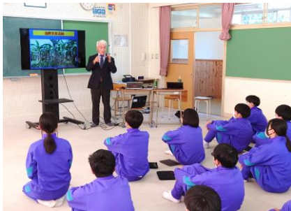
過去の災害から学ぶ

前半は恵那市防災研究会の方から、明智町で過去に起きた災害について説明していただき、自分たちが住んでいる地域の地図をもとに、災害図上訓練（DIG 演習）をおこないました。後半は危機管理課の方から、災害時の避難方法や身の守り方について教えていただきました。