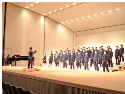
3年生合唱「涙そうそう」