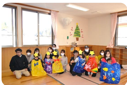
年少児りす組「3びきのこぶた」