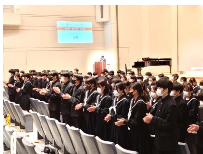
ハンドクラップ「心花」