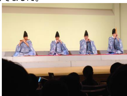
雅楽の演奏（明智伶人会の皆さん）