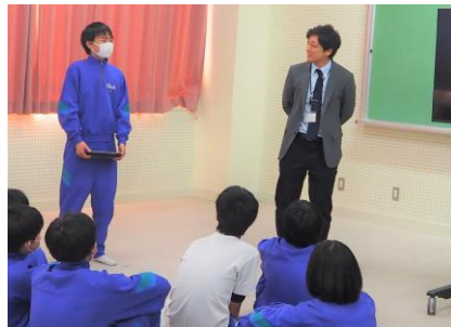
災害時の身の守り方を学ぶ