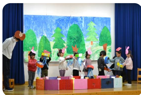
年中児ぱんだ組「おおきなかぶ」