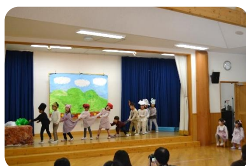
年長児きりん組「わらしべちょうじゃ」