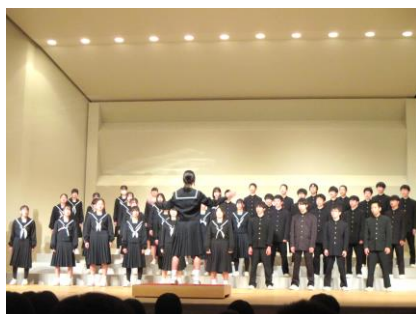
2年生合唱「地球星歌」