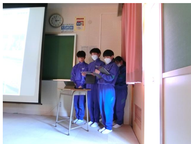
1年生による学校説明