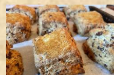
スコーンとロックケーキ