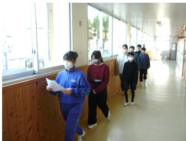
3年生による校舎案内

最初に日程説明を行い、その後で保護者向けに学校説明を行いました。それに並行して小6の皆さんには中学生の授業や学校内を参観してもらいました。その後、1年生の生徒が、小学生の皆さんと保護者の皆さんに対して、明智中学校の行事や生活、部活動などについて、映像資料を交えて説明を行いました。参加した小学生から、「中学校のことがよくわかった。」「中学校への不安が、和らいだ。」などの声が聞かれました。