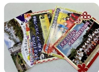
地域カレンダー作成