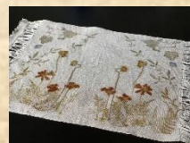
植物を染め写した麻のマット