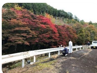
下ヶ淵ライトアップ